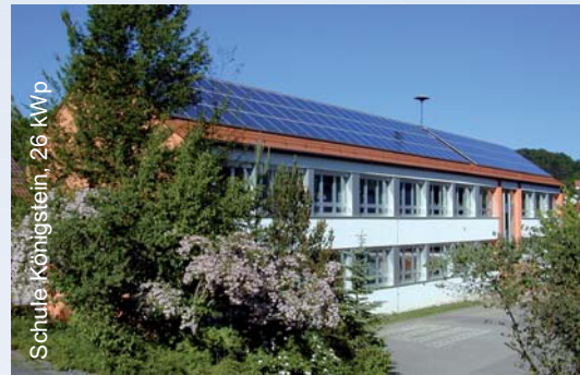
Schule Köhligstein, 26 kWp

Profitieren Sie von unserem kompetenten Service mit GRAMMER SOLAR an unserer Seite, von der kostenlosen Planung und Beratung bis hin zur kostenlosen Wirtschaftlichkeitsberechnung. Die Leistungen von Grammer Solar sind selbstverständlich vom TÜV oder RAL zertifiziert!