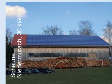
Scheune Niederrach, 30 kWp