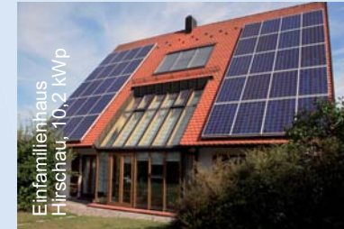
Einfamilienhaus Hirschau, 10,2 kWp