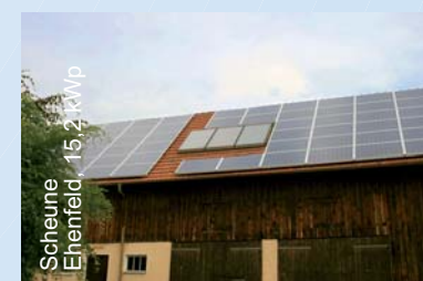
Scheune Ehenfeld, 15,2 kWp