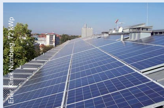
Ener-Strom Nürnberg, 72 kWp