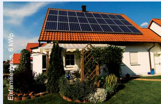
Einfamilienhaus Dierdorf, 6 kWp