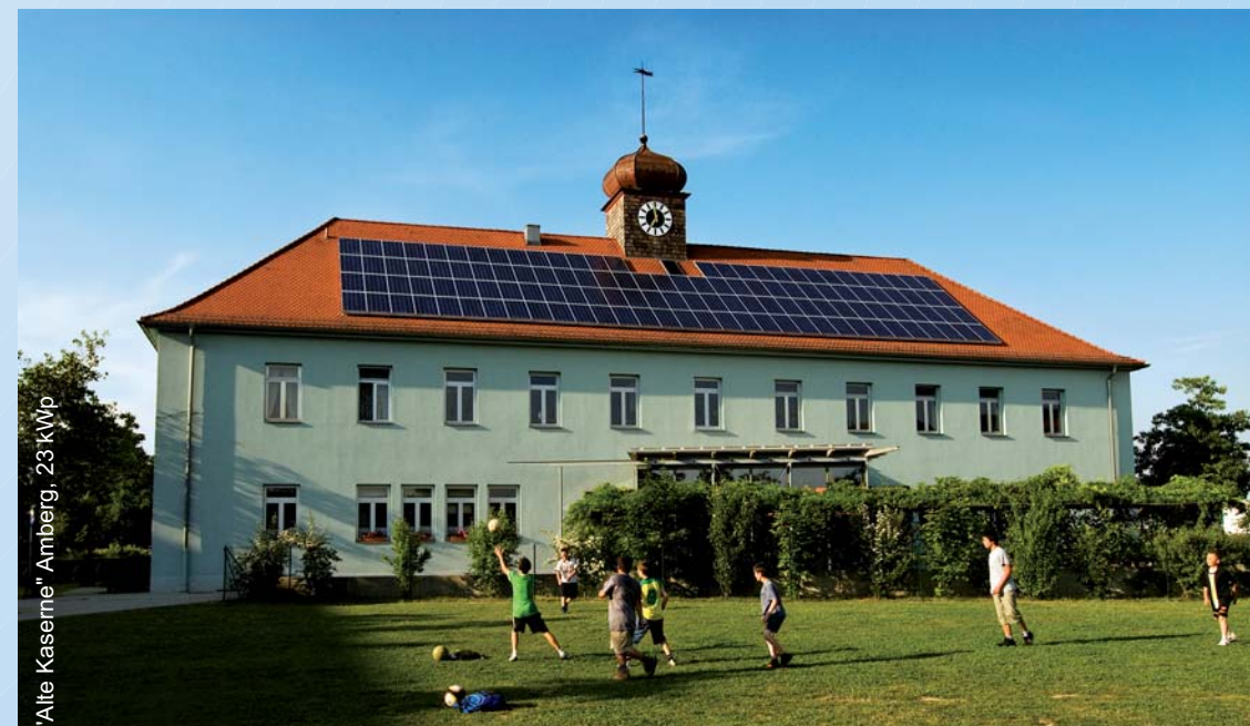
"Alte Kaserne" Amberg, 23 kWp

GRAMMER SOLAR ist TÜV-geprüfte Qualität für netzgekoppelte Solarstromanlagen