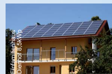
Einfamilienhaus Dierdorf, 6,5 kWp